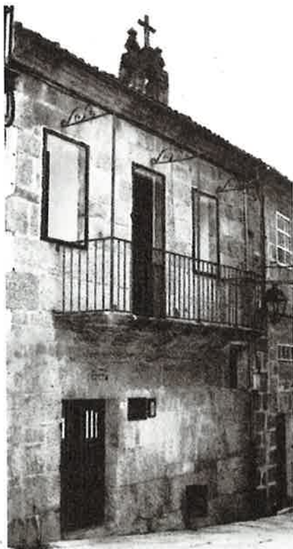
Actual sede Consello Regulador D.O. Ribeiro

Os hospitais facían un labor importante non só hospitalaria, senón de albergue para pasar a noite ou soamente descansar. A importancia de Ribadavia no camiño Xacobeo foi moi importante para os peregrinos que viñan de Portugal, uníndose aos arrieiros no camiño.